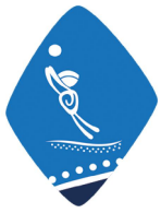
TABLA DE RESULTADOS (FASE PRELIMINAR) a 27 NOV 2014 RESULTS TABLE - PRELIMINARY PHASE